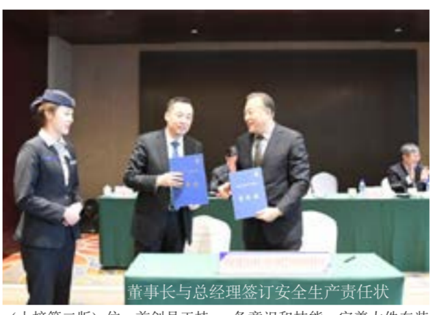
董事长与总经理签订安全生产责任状